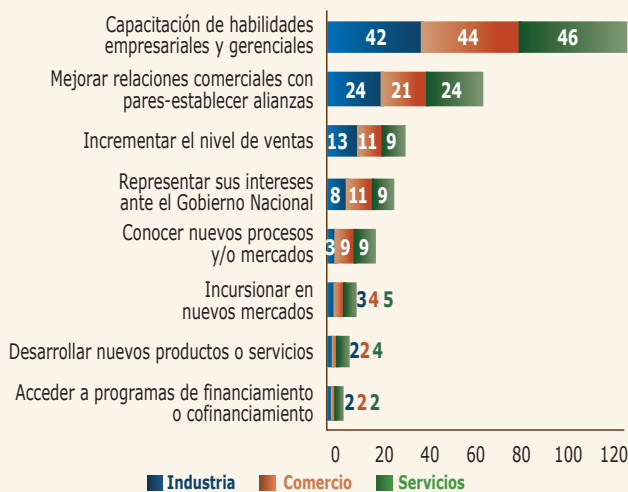
Gráfico 2. ¿Cómo considera usted que le ha beneficiado a su empresa la alianza con esta entidad?

capital social empresarial de la pequeña y mediana empresa en Colombia es muy bajo. La mayoría de las empresas está vinculada con la Cámara de Comercio, pero existe una muy baja participación-asociación de los empresarios colombianos con las instituciones del Estado, gremios y universidades. Por otro lado, los beneficios de estas alianzas se basan en actividades de capacitación en lugar de las de innovación y exportación (nuevos mercados, nuevos productos, entre otros). Estas carencias podrían limitar el crecimiento y productividad de este segmento empresarial en el futuro.