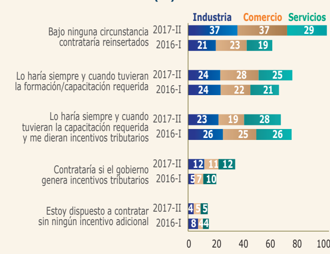
Gráfico 2: ¿Bajo qué circunstancias estaría usted dispuesto a contratar personas reinsertadas en su empresa? (%)

Por ello, es labor del Gobierno Nacional, para contrarrestar estos dos choques sobre el empleo, evitar la salida fácil de repartir más gabelas tributarias en medio de elevados faltantes presupuestales. En este frente, se necesita concentrarse en labores como la agilización de trámites migratorios (incentivando la formalización laboral), incrementar-fortalecer las labores de capacitación (por ejemplo, a través del Sena) e implementar mecanismos de empleo diferencial temporal (para reinsertados) como los propuestos para los jóvenes aprendices (ver Comentario Económico del Día 14 de diciembre de 2017).